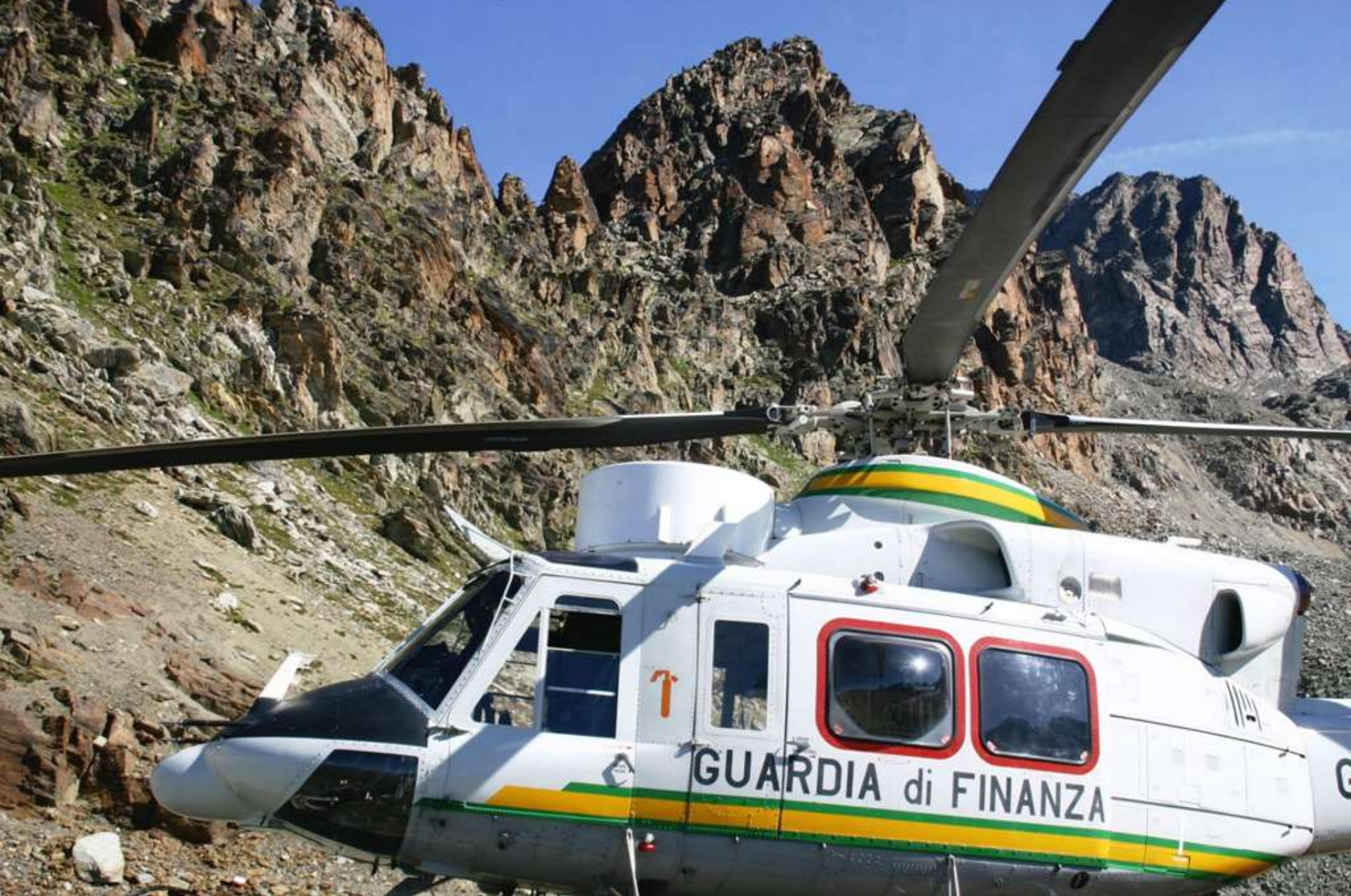
. Atterraggio elicottero HH 412C a Caspoggio (SO)