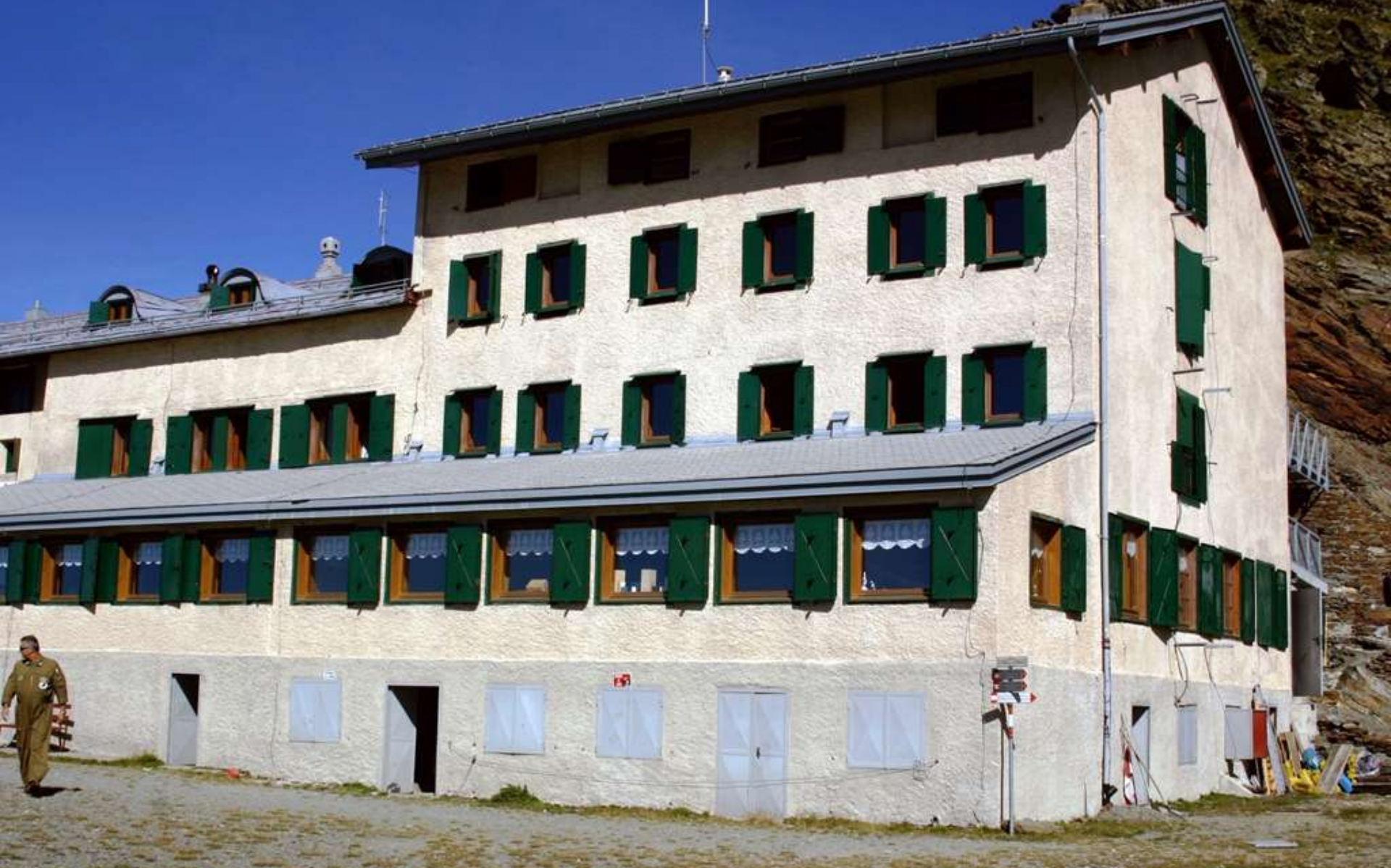
Rifugio Marinelli /Bombardieri , Valmalenco (SO) - Q. 2813 mt.