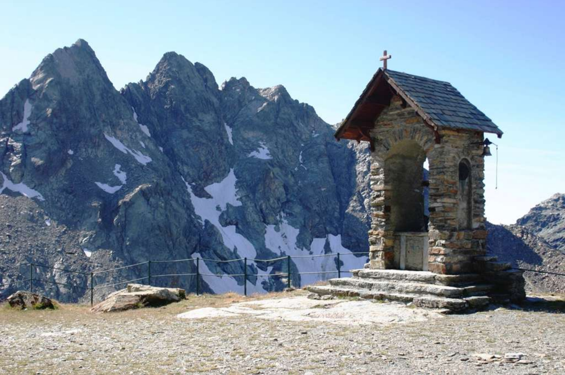
Cappelletta votiva a Caspoggio ( SO )