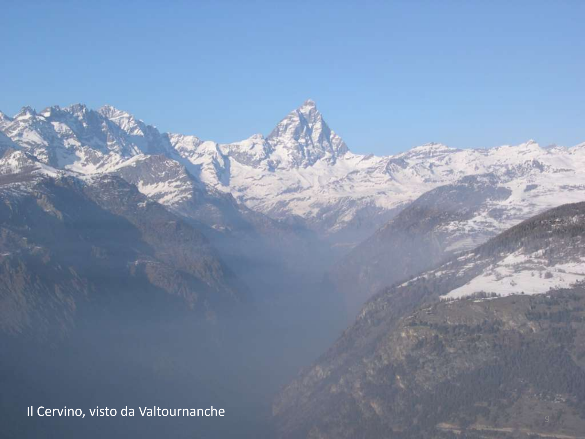
Il Cervino, visto da Valtournanche