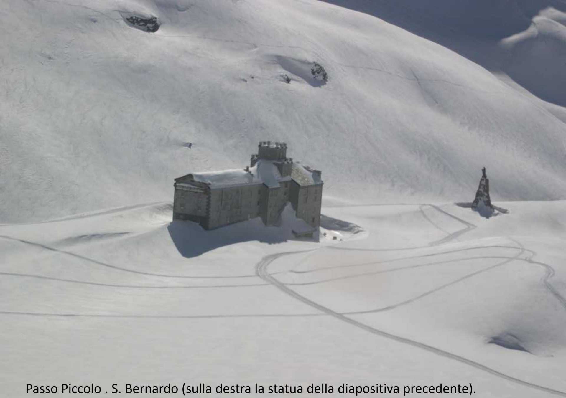
Passo Piccolo . S. Bernardo (sulla destra la statua della diapositiva precedente).