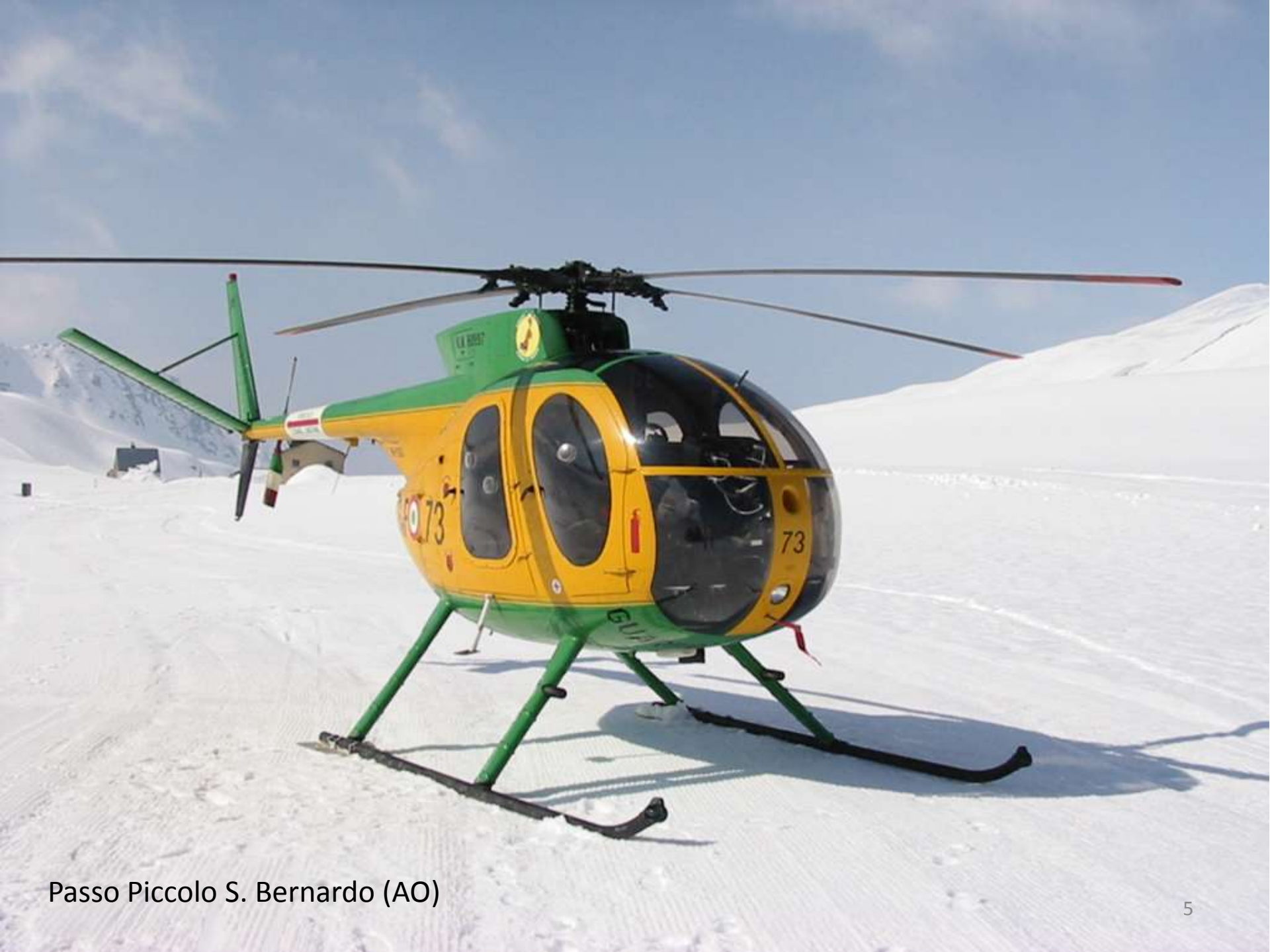
Passo Piccolo S. Bernardo (AO)