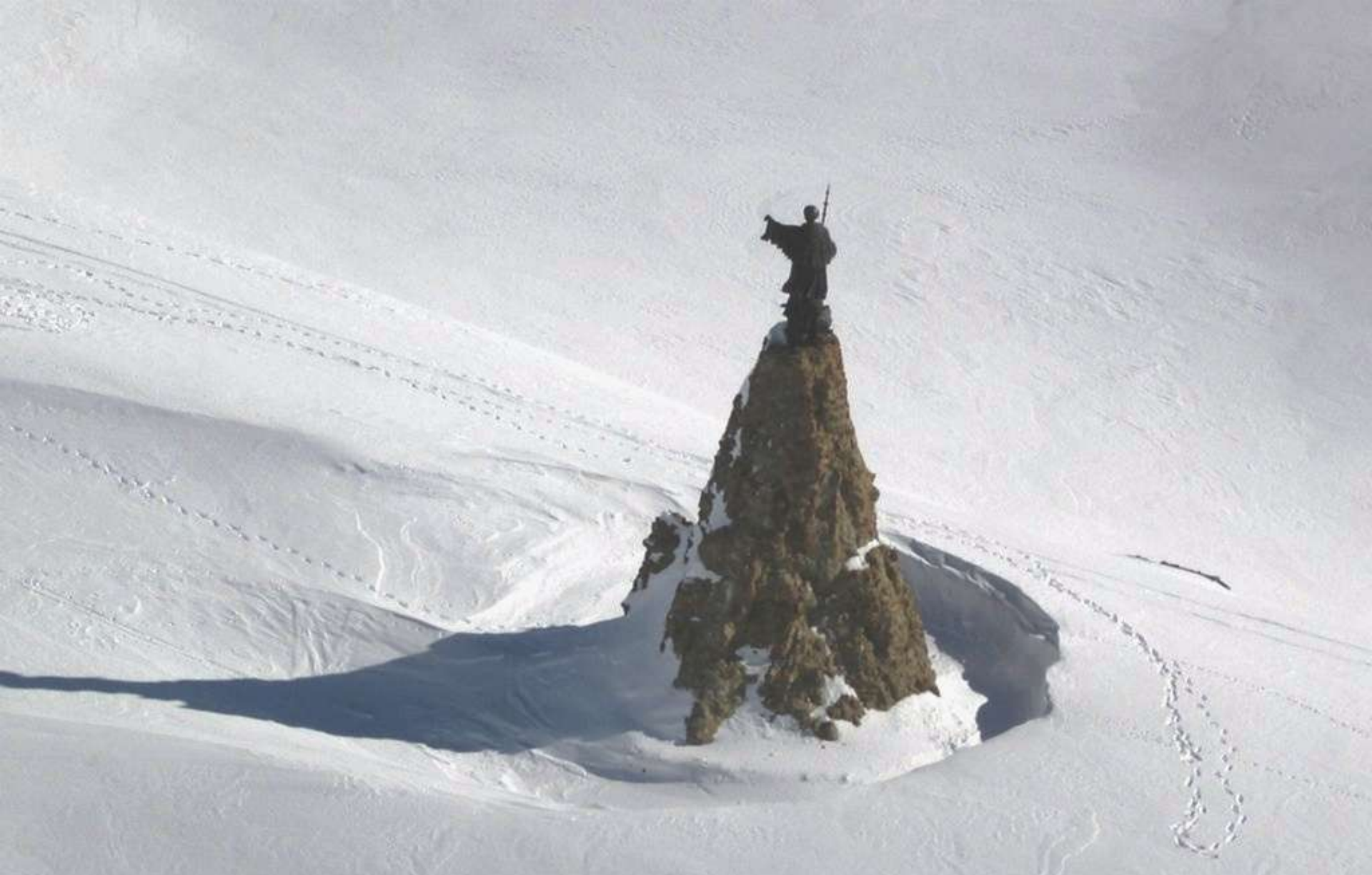
Statua di San Bernardo.