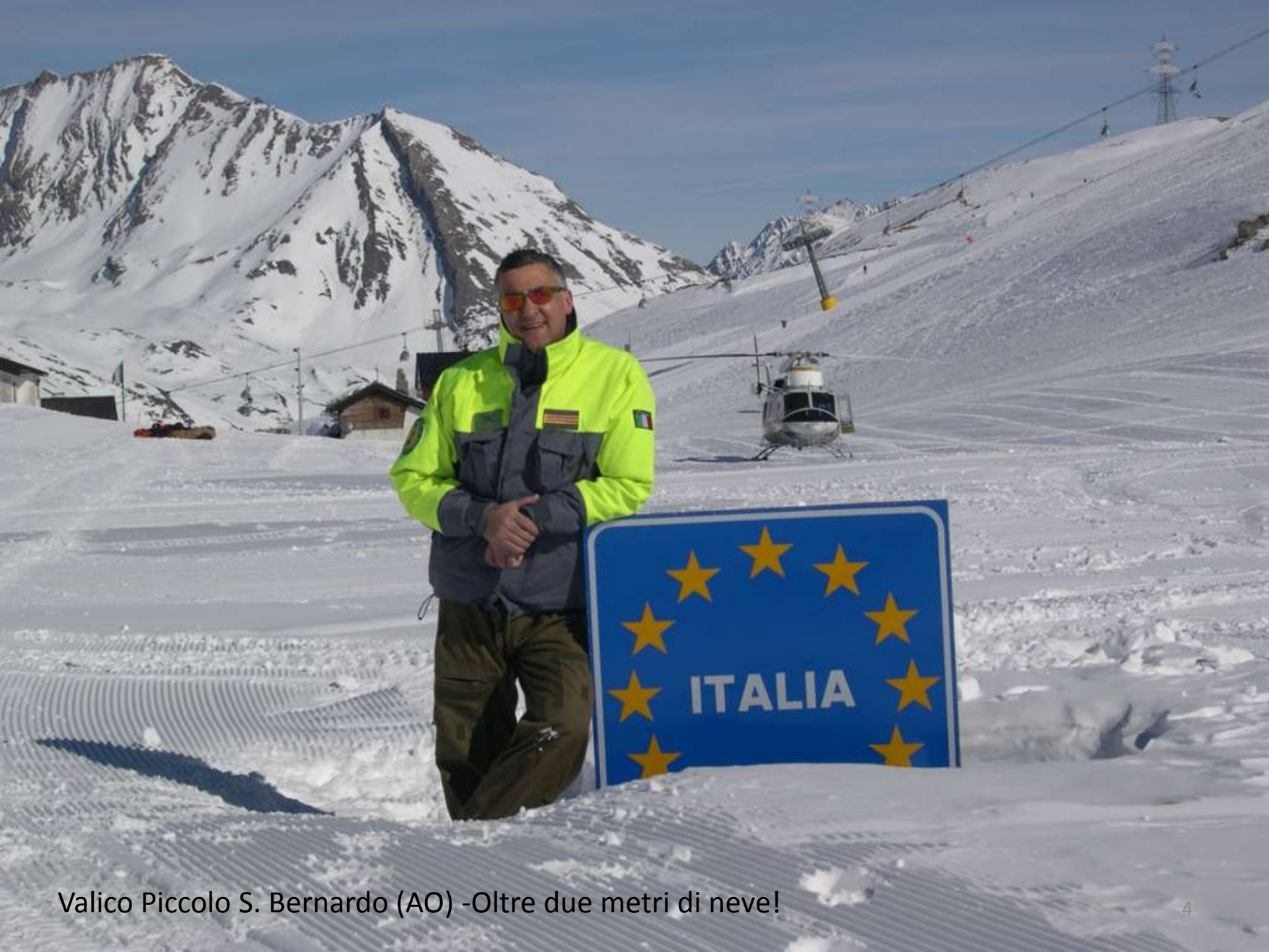
Valico Piccolo S. Bernardo (AO) -Oltre due metri di neve!