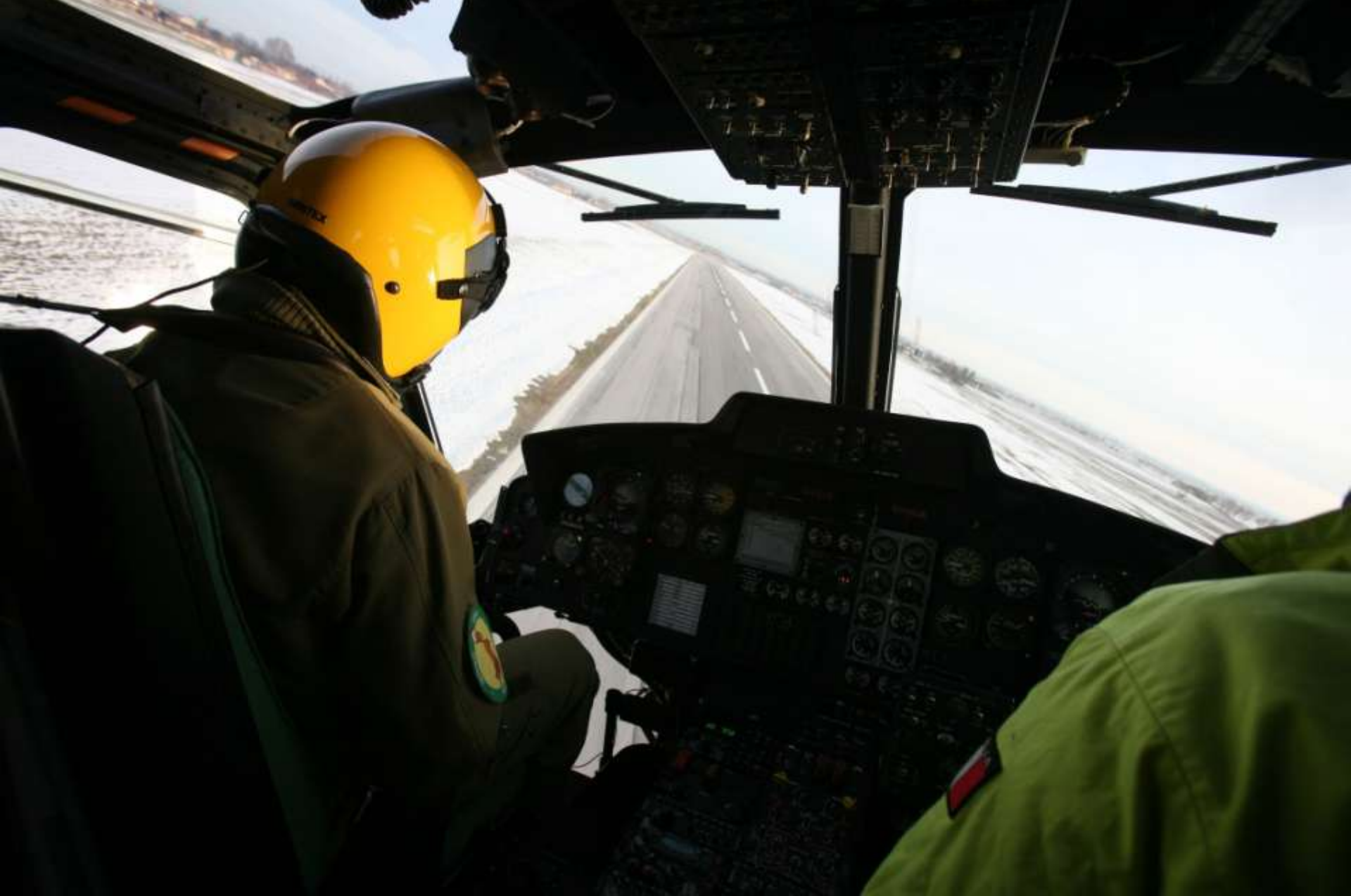
Aeroporto di Levaldigi (CN)