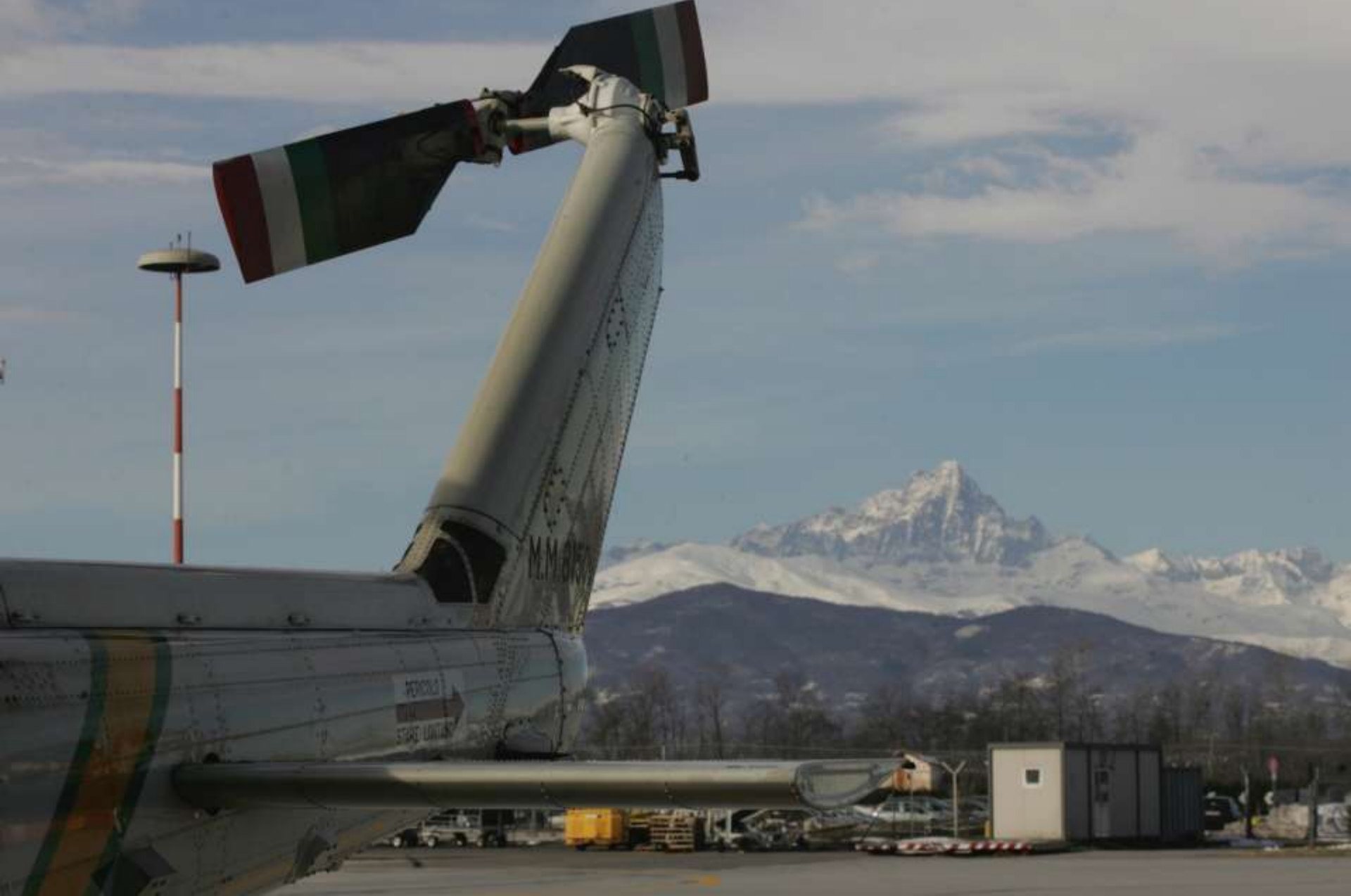
Aeroporto di Levaldigi (CN) – foto col Monviso sullo sfondo.