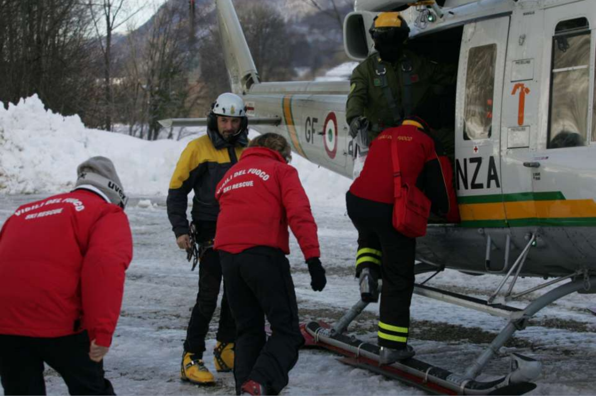
Imbarco di Vigili del Fuoco.