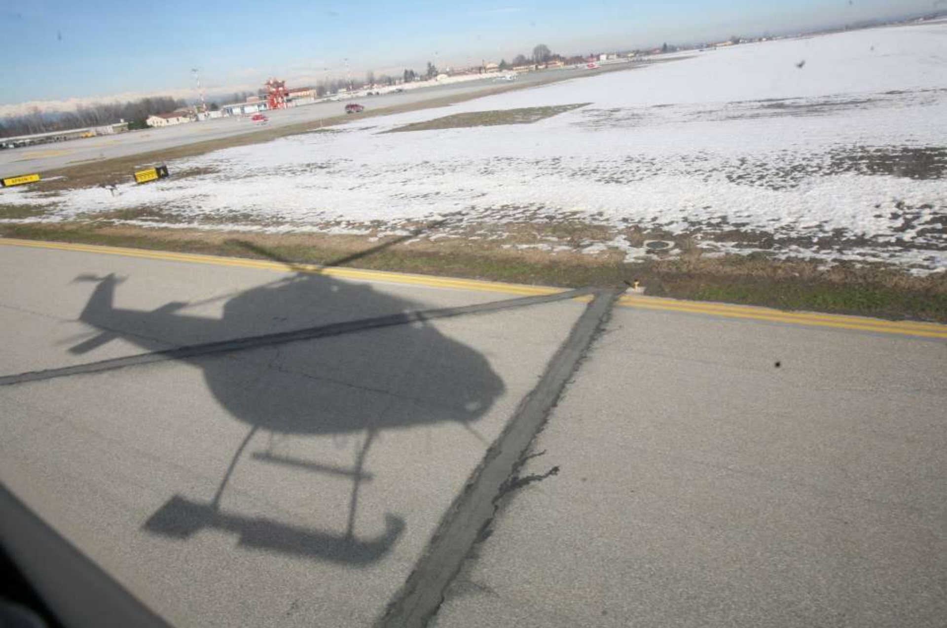
Aeroporto di Levaldigi (CN)