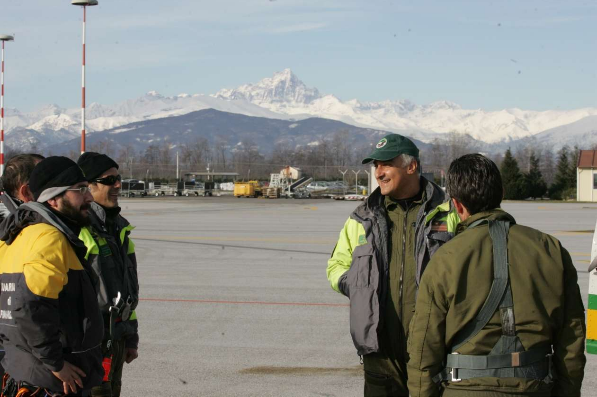
Aeroporto di Levaldigi (CN) – foto di gruppo col Monviso.