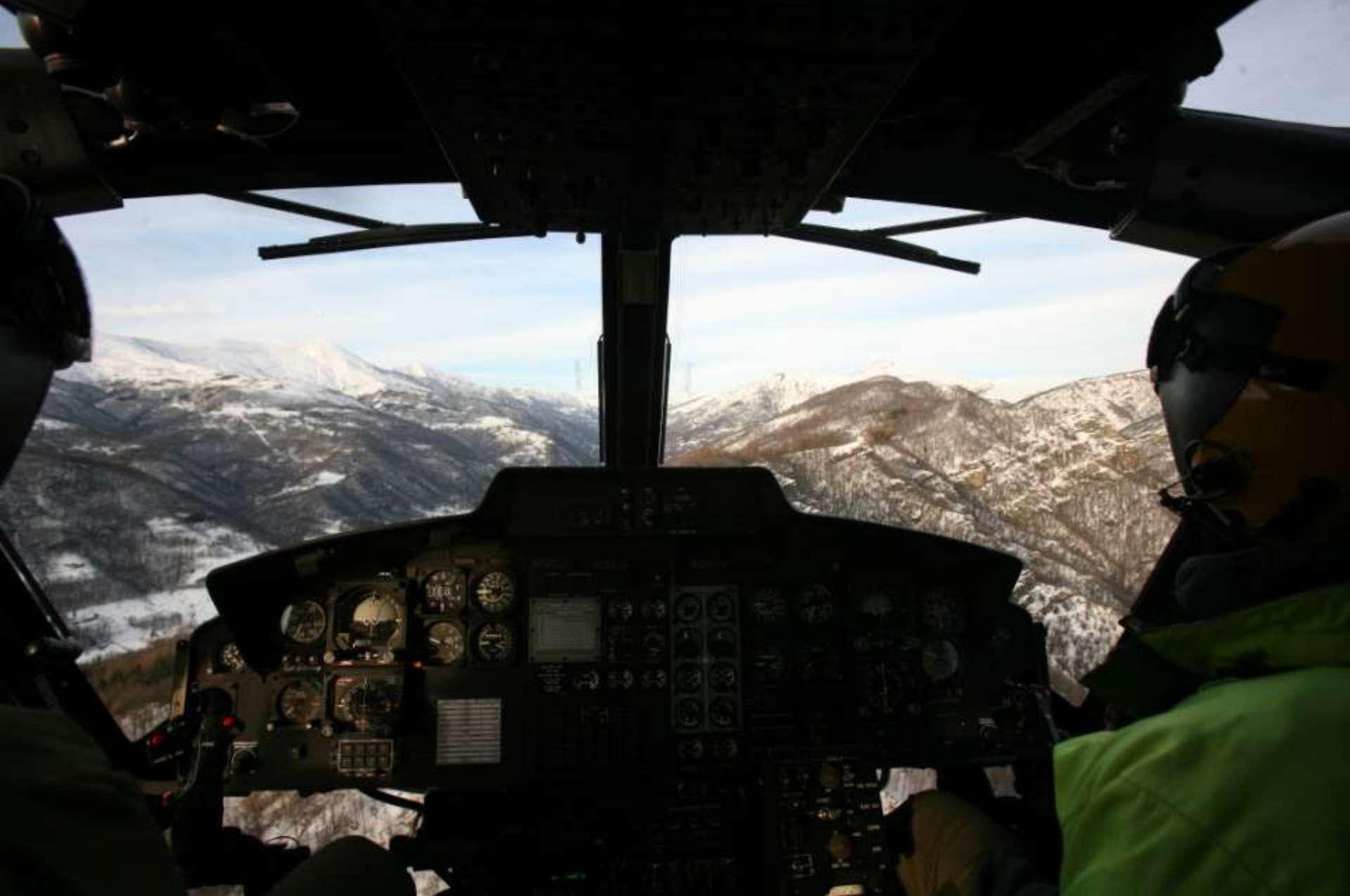
Sorvolando la Valle Stura.