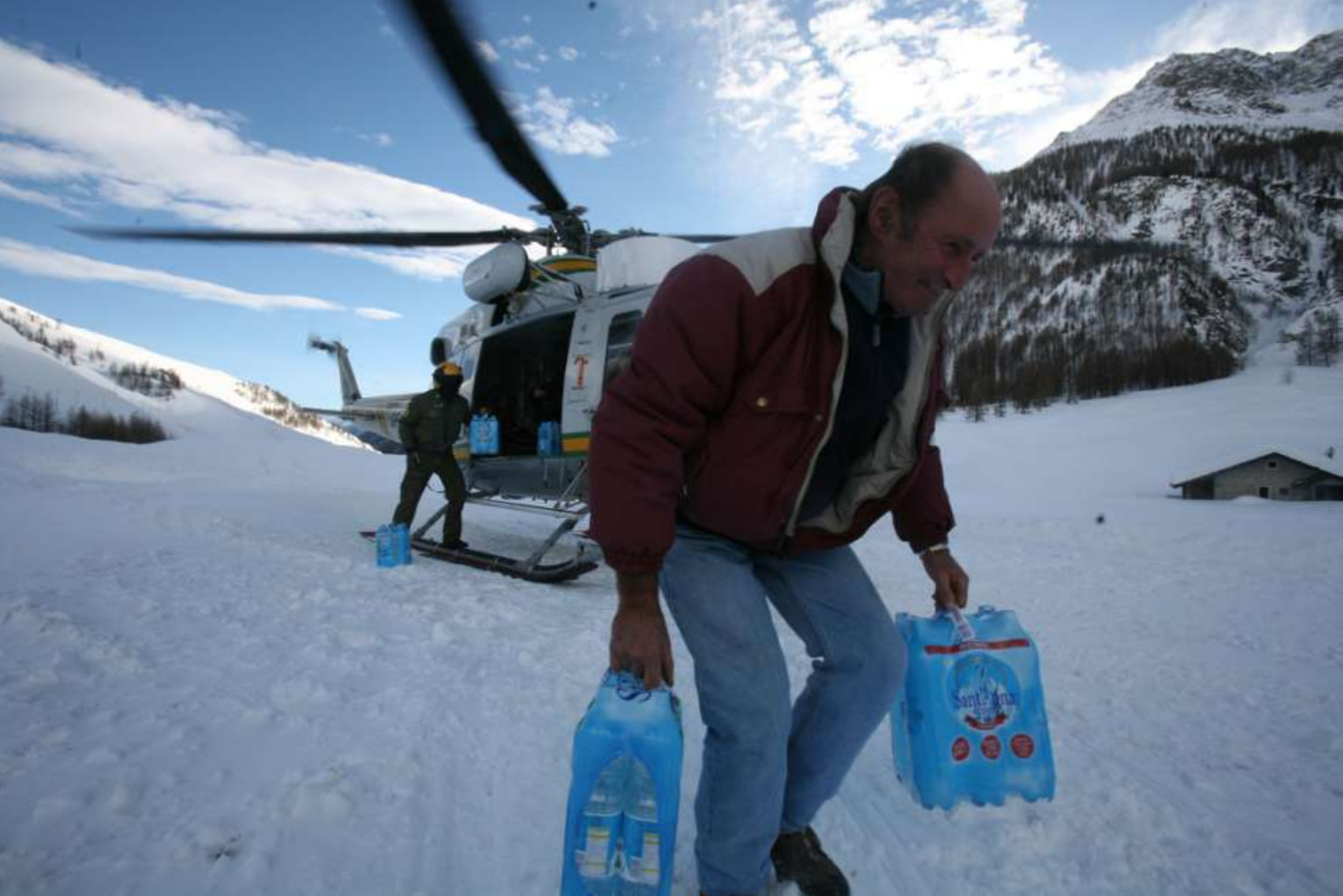
Sbarco generi alle frazioni isolate.