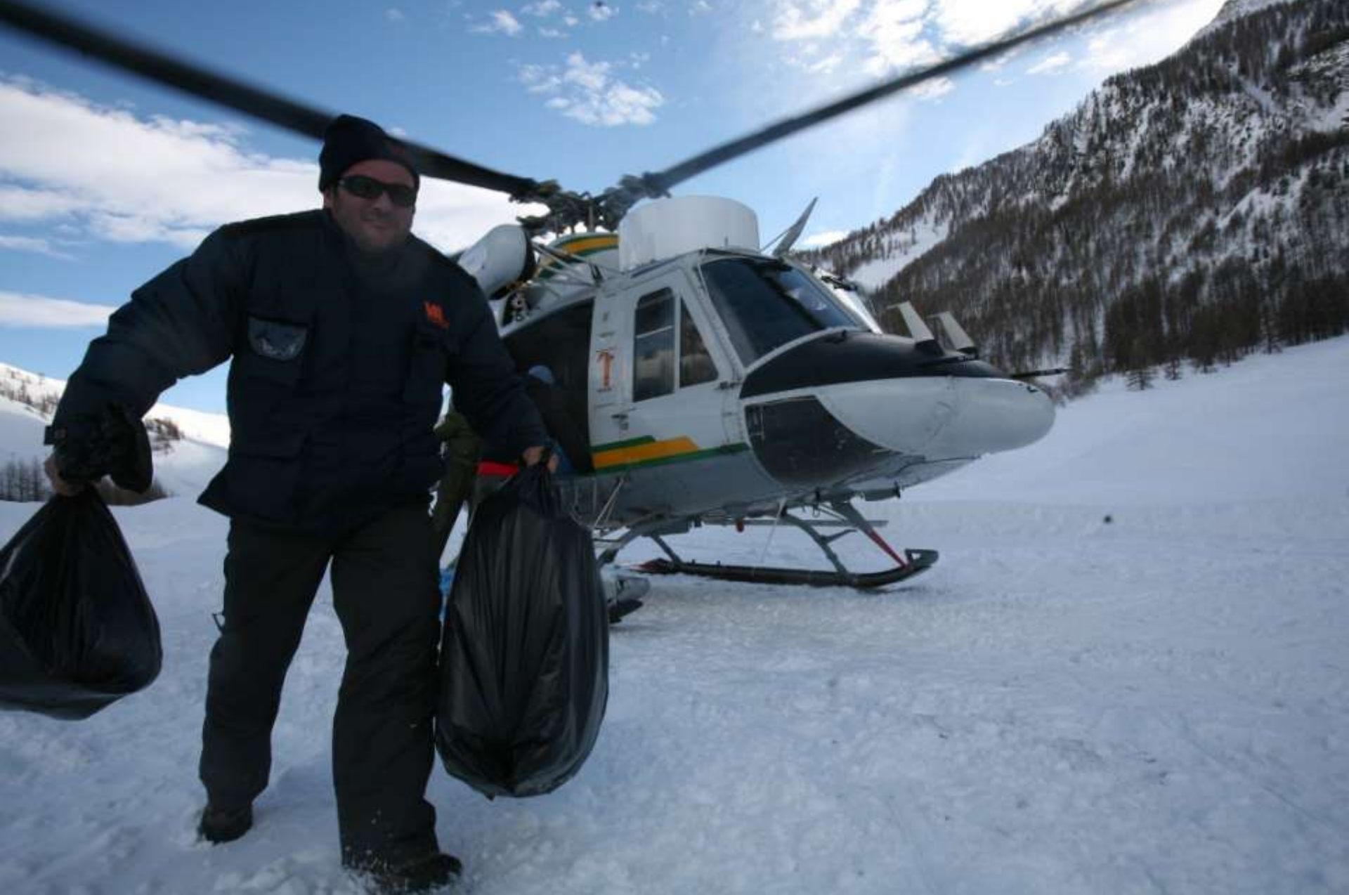
Sbarco generi alle frazioni isolate.