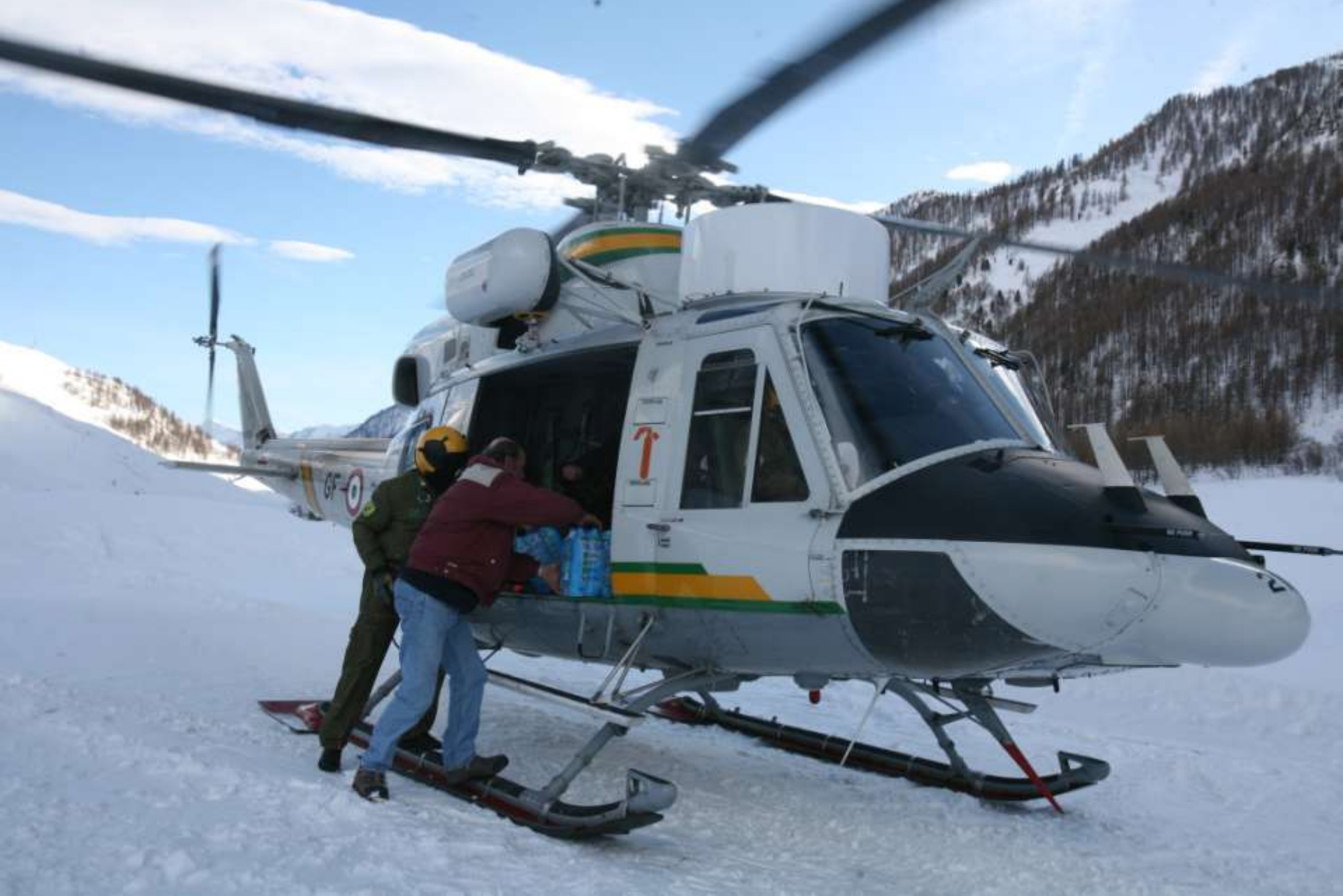
Sbarco generi alle frazioni isolate.