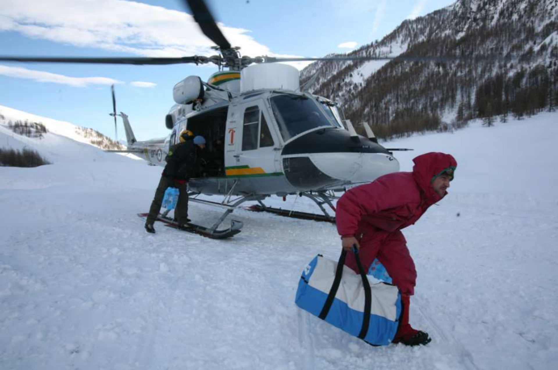
Sbarco generi alle frazioni isolate.