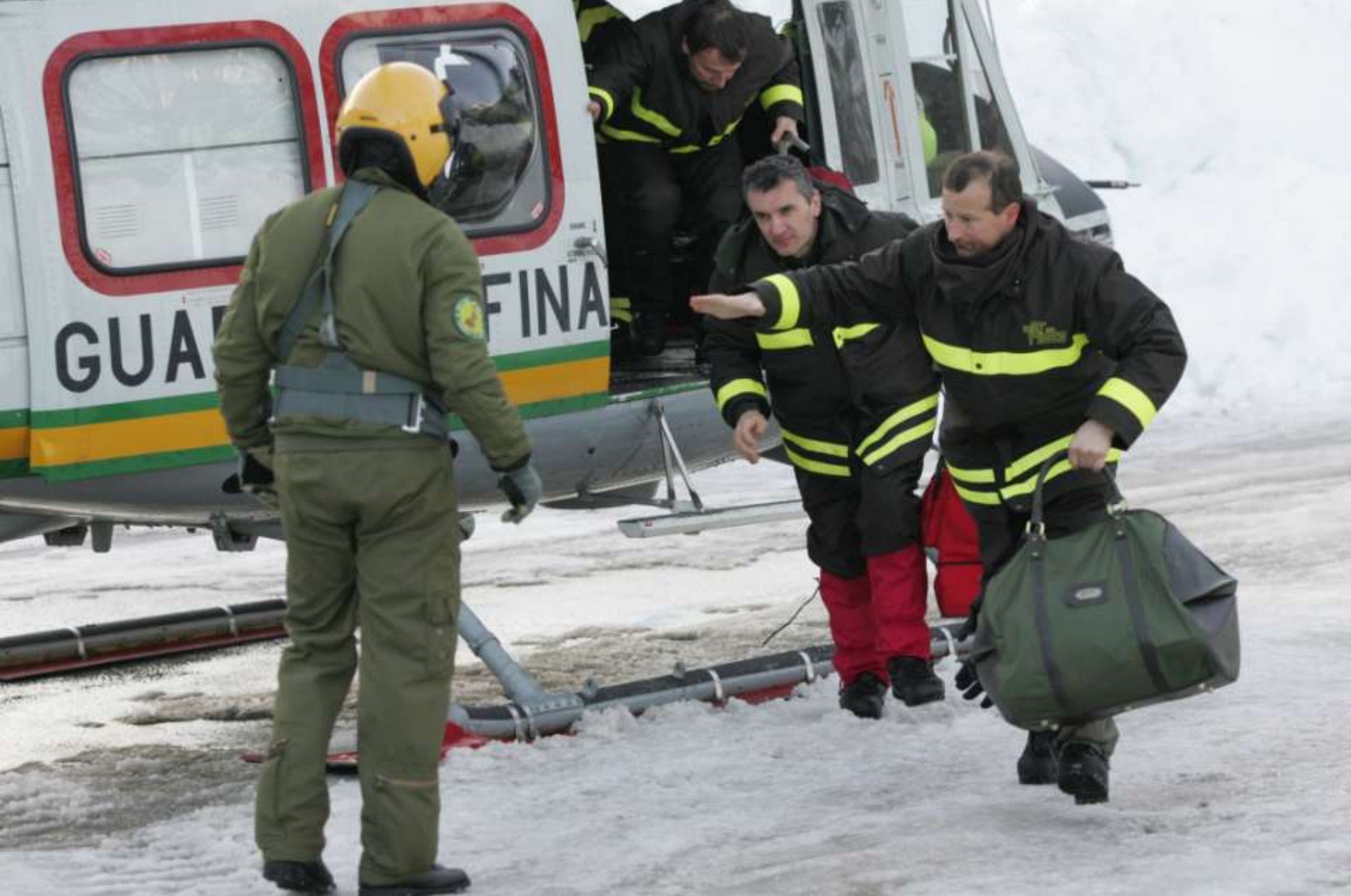
Uno sbarco di soccoritori.