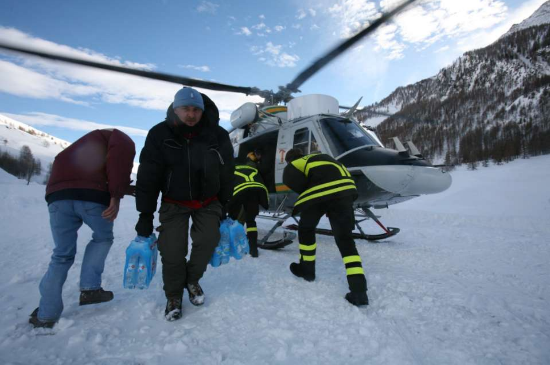
Sbarco generi alle frazioni isolate.